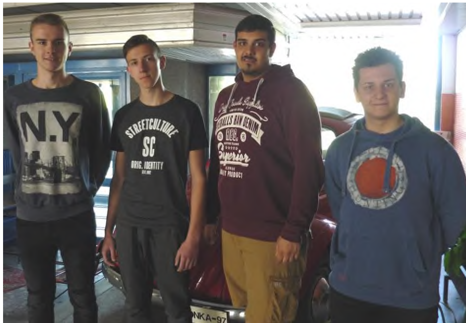
A díjazott tanulók

Orvos Brendon 9/4 (Juhász Gyula: Magyar nyár 1918)