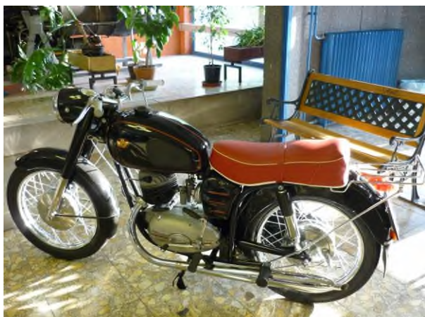
Veterán Pannónia az aulában

A Csonka János Műszaki Szakgimnázium és Szakközépiskola sok rendezvénnyel várta a járműtechnika iránt érdeklődőket 2017.04.21-én. Honlapunkon minden látogató részletes tájékoztatást kaphatott a programokról, melyek közül kedvére válogathatott.