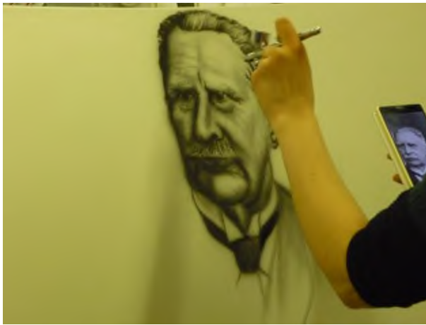
Dekor-fényezés bemutató csomagtartón