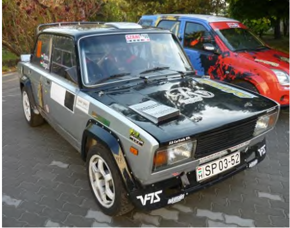
Rally autók a Csonka téren