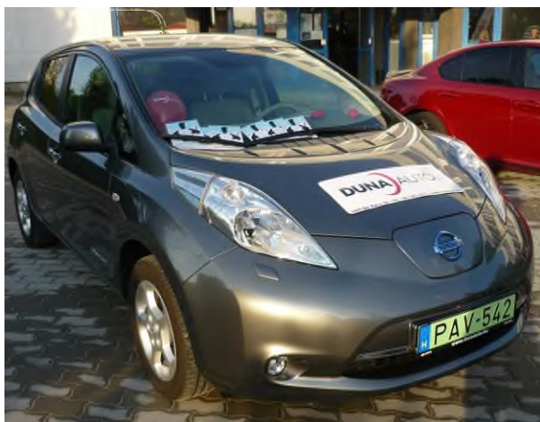
Elektromos Nissan Leaf