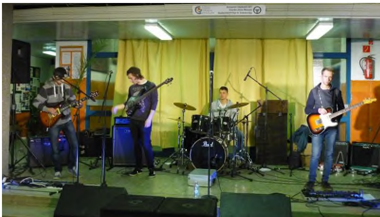
KisCipő zenekar koncertje