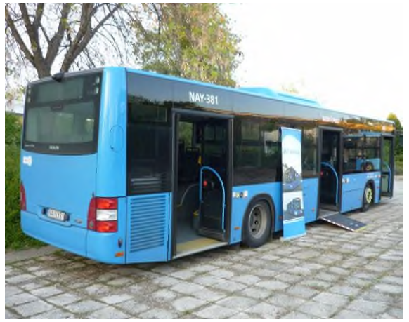
Man autóbusz a Királydombon