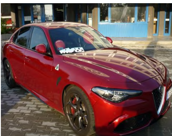
Ferrari motoros Alfa Romeo 16