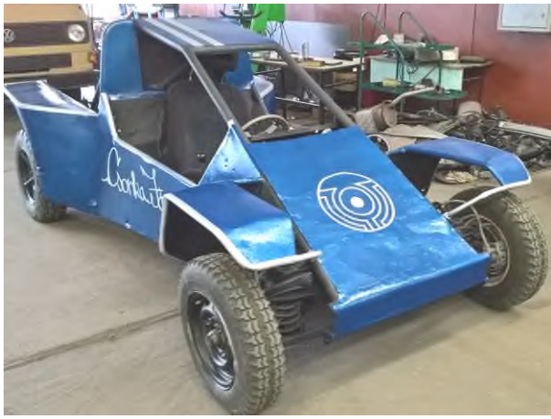
A Szöcske iskolánk tanulóinak alkotása